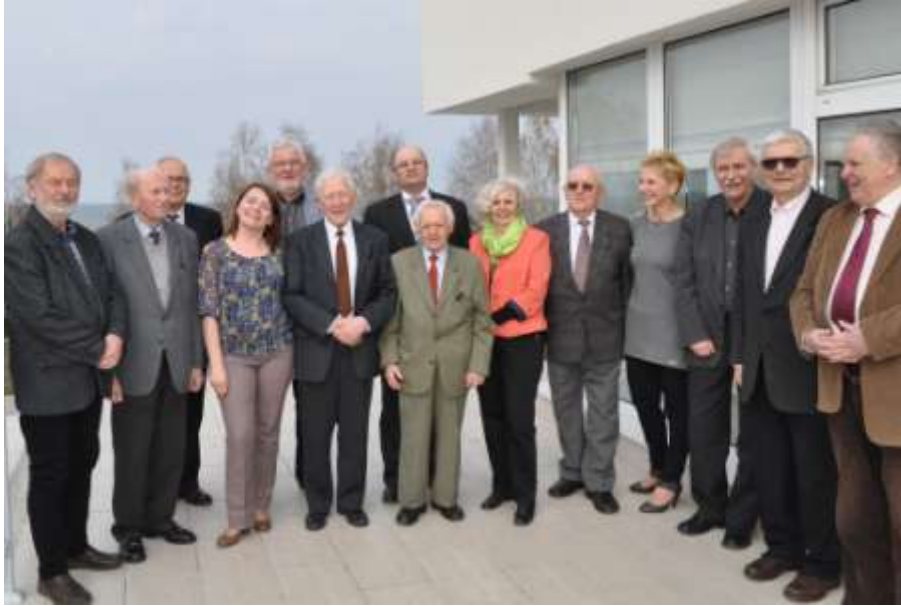
Członkowie zarządu wraz z seniorami - 2016