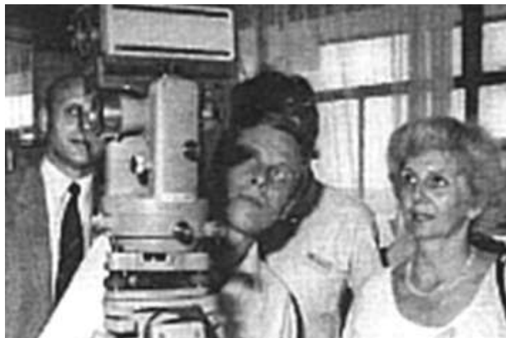
Dalmierz bezlusterkowy DIOR firmy WILD / Konferencja Żarnowiec 1986

materiałów, sprzętu i aparatury pomiarowej przygotowana przez renomowane firmy europejskie. Założeniem konferencji była wymiana doświadczeń w zakresie obsługi geodezyjnej skomplikowanych, wielkich budowli o dużym stopniu trudności i wykorzystanie ich przy budowie elektrowni jądrowej w Żarnowcu.